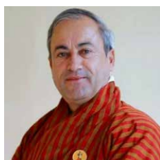
S.E. Lyonpo D. N. Dhungyel

Minister für auswärtige Angelegenheiten und Außenhandel